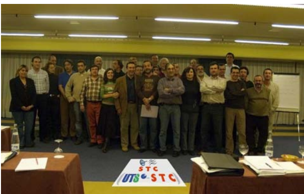
Comisión Permanente de STC(UTS-STC)

Esta unificación ha sido fruto de las exigencias y el apoyo de los afiliados, y por ende de una parte importante de la plantilla de Telefónica, que nos hicieron ver la necesidad de vertebrar y afianzar un sindicato verdaderamente independiente que defendiera real y eficazmente los derechos de los trabajadores de nuestra empresa. El esfuerzo demandado y exigido por la afiliación a ambas Organizaciones era el de trabajar conjuntamente en la construcción de una opción sindical que resultase atractiva y eficaz para todos los trabajadores que consideran que la situación laboral de Telefónica, y de todo el dinámico y cambiante sector de las comunicaciones, necesita sindicatos de fuertes principios y capacidad de negociación.