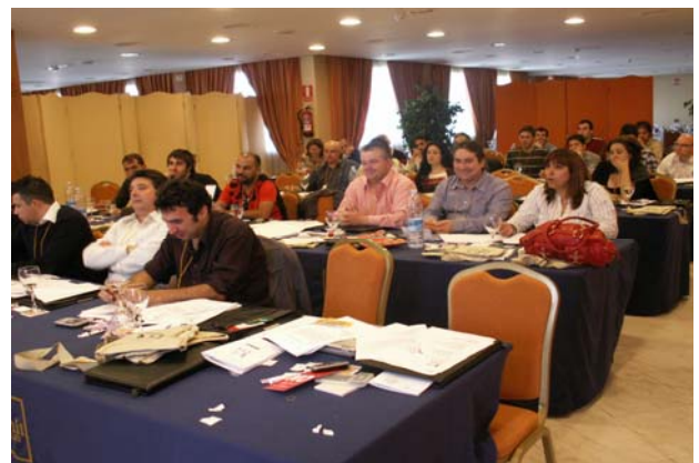
Reuniones de trabajo de ONO

“EL 28 DE FEBRERO SE INICIÓ EL PROCESO PARA LA NEGOCIACIÓN DEL I CONVENIO DE EMPRESA DEL GRUPO ONO.”